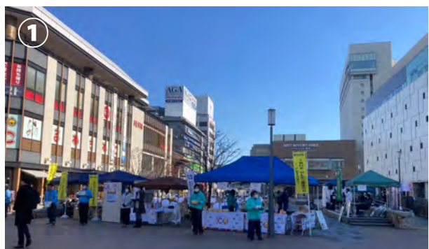
①全体写真 ②願いを繋ぐ音楽会 ③能登半島地震への募金活動